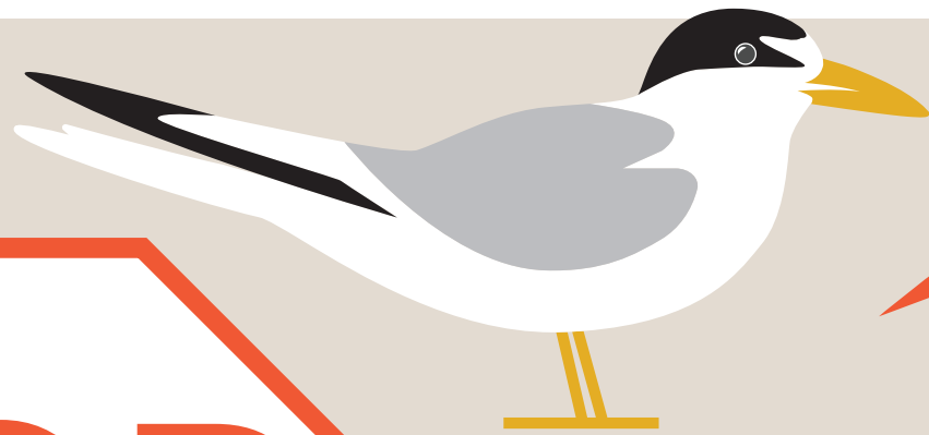
Least Tern Charrancito americano

La temporada de anidación es del 1 de marzo al 1 de septiembre