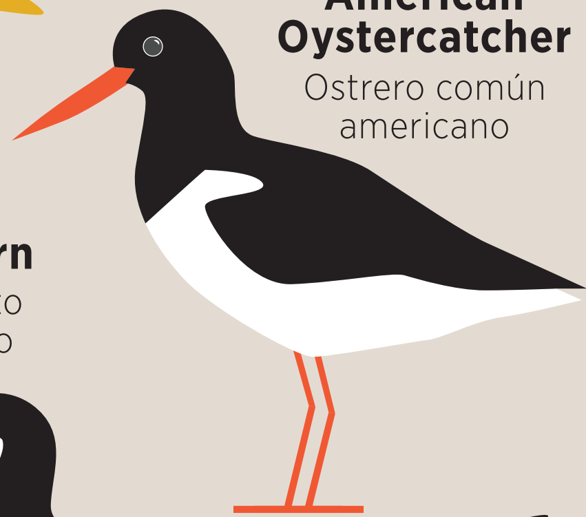
American Oystercatcher Ostrero común americano